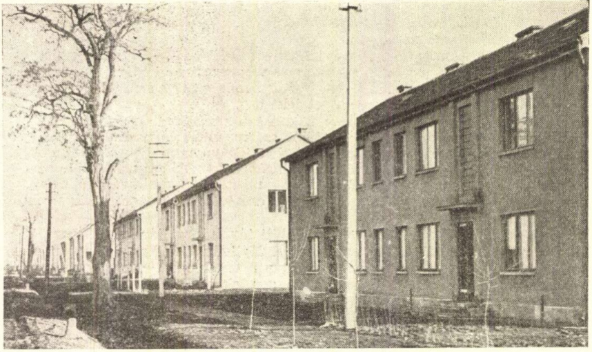
Az edelényi új városrész bányász lakótelepe

lépett a szövetkezetbe, — nemrégén végezte el az agráregyetemet, itt a gyakorlatban ez lesz az első, nagy vizsgatétele. Én pedig azért szorongtam, mert ez az a táj, a Bódva-völgy, ahol paraszt-ösök szültek engem is, s vajon azt a tudást, amit a szőlőtőkék és gyümölcsfák birodalmában eddig gyerekkoromtól felszedtem, hasznosan fogom-e itt gyümölcsöztetni azzal a tanáccsal, amit kértek tőlem, alig 10 nappal ezelőtt.