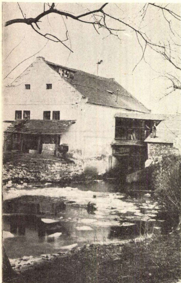
Az edelényi malom melletti Boldva-ág, ahonnan az öntözéshez a vizet a zöldségtermeléshez szivattyúval emelik ki.

csak az ellenforradalom után léptek ki néhányan a termelőszövetkezetből — mindössze 6 személy, egy tagot pedig maguk zártak ki. Az akkor kilépettek ismét szövetkezeti tagok. Szó sem volt a szövetkezeti vagyon tépázásáról, széthordásáról. Így tudták elérni, hogy 1957-ben munkaegységük tovább növekedett 72 forintra, 1958-ban is 67 forint volt a sok természeti tényező okozta kár, a gyengébb termés ellenére is. 1959-ben pedig több mint 60 forintot fizettek,